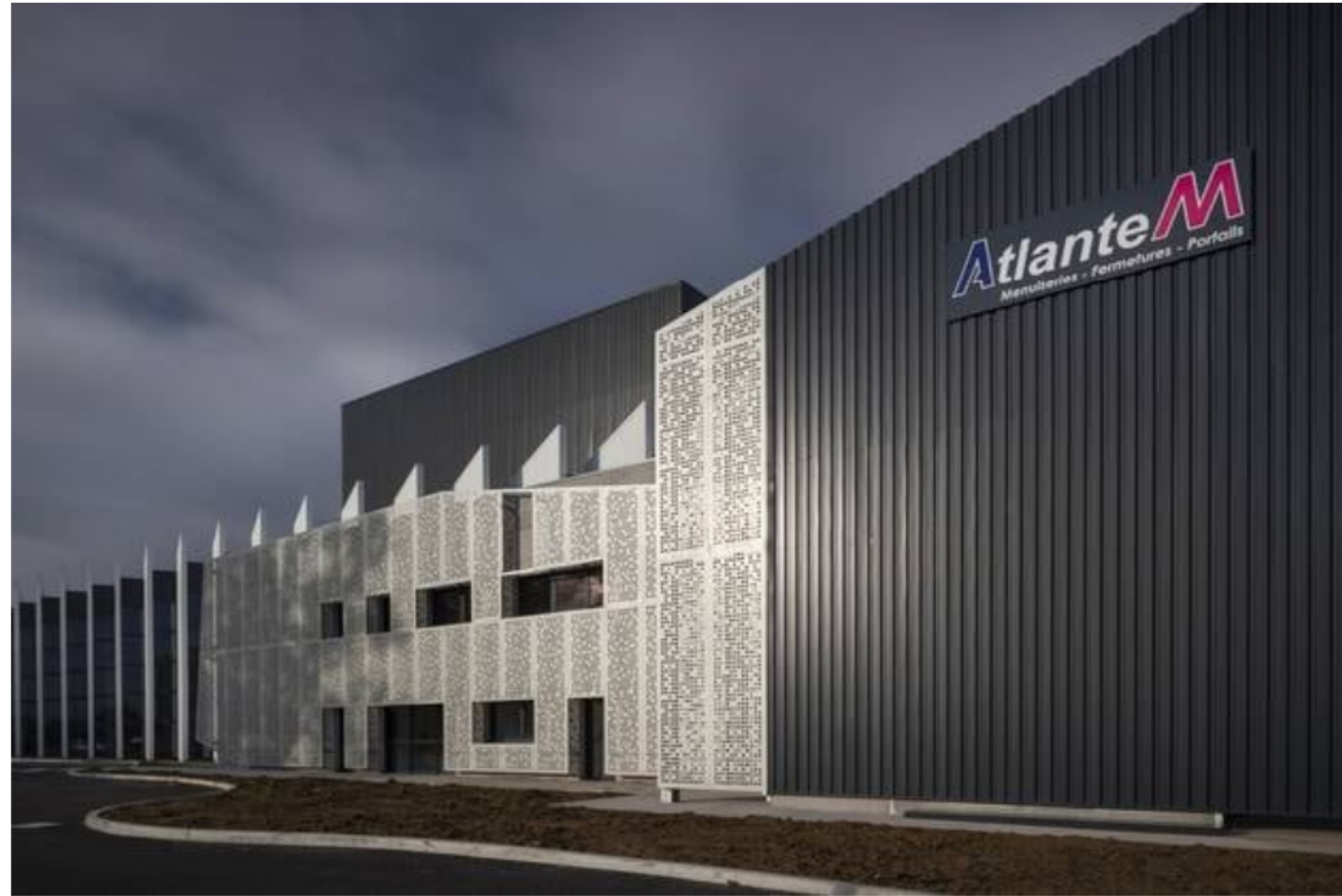
Près de 80 % des salariés sont prêts à reprendre le chemin du travail.

Oui, ce sera le 14 avril. Si on arrive à reprendre à 30 % du volume de production habituelle la première semaine, ce sera déjà bien. Il faut aussi bien mettre en place les protocoles sanitaires. Même si le chiffre d'affaires réalisé ne couvre pas les charges fixes, il faut en passer par là. Nous sommes un secteur clef, non délocalisable, avec aussi beaucoup de matières produites en France. Le schéma de reprise d'activité sera dépendant de l'approvisionnement en matières premières comme les vitrages pour lesquels nous avons seulement deux ou trois jours de stocks.