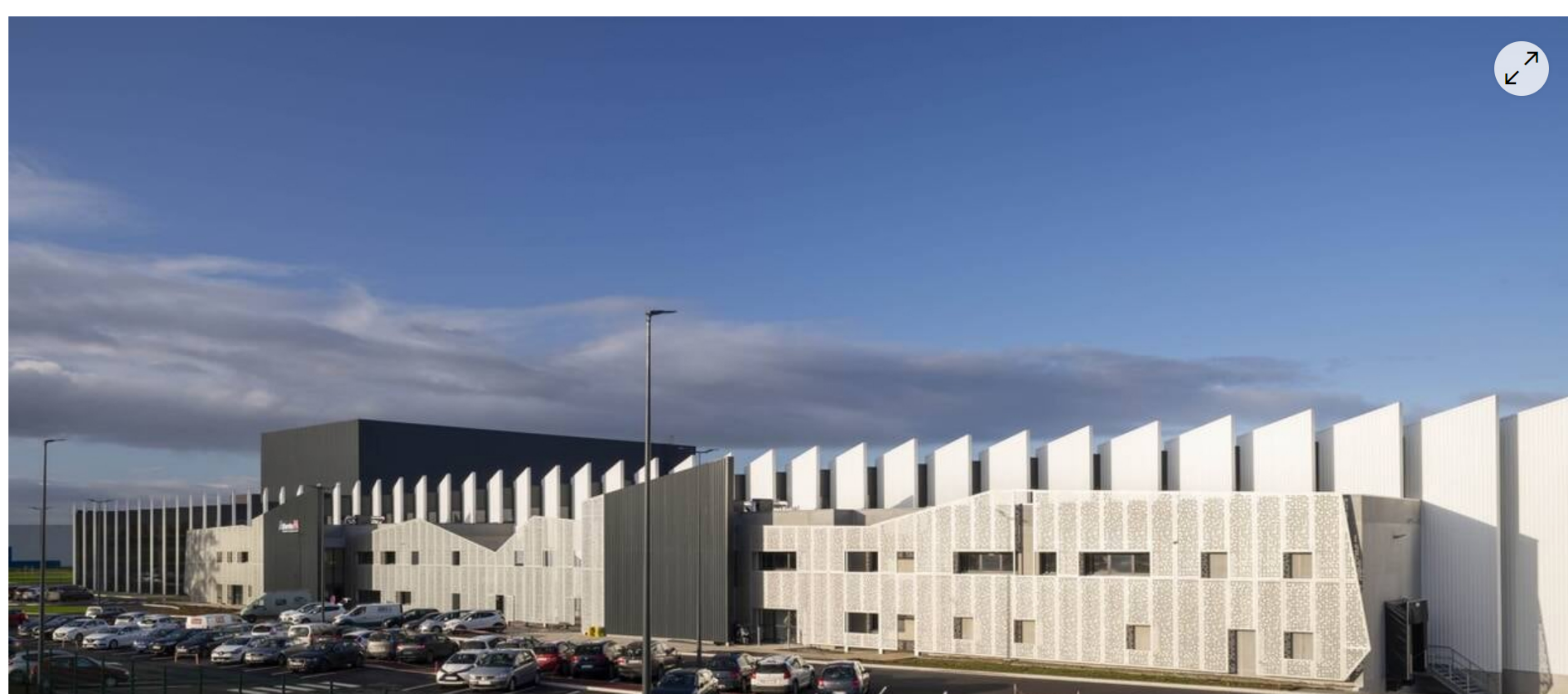
L'usine de fabrication de Atlantem est à l'arrêt comme de nombreux sites industriels depuis le 17 mars